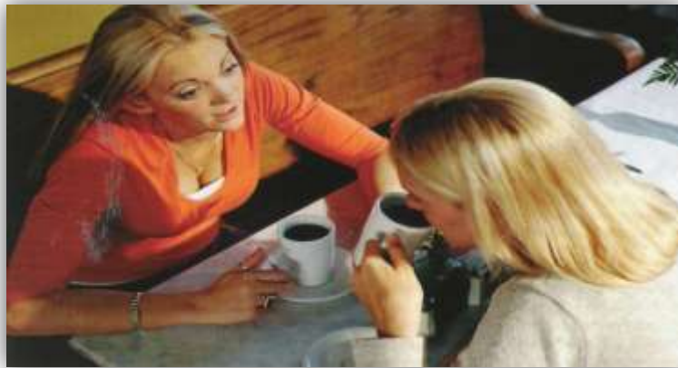
การพูดคุยกับเพื่อนและจิบกาแฟไปด้วยถือเป็นส่วนหนึ่งของพิธีกรรมทางสังคม

ประการแรก เราสามารถชี้ให้เห็นได้ว่า กาแฟไม่ได้เป็นแค่เครื่องดื่มที่สร้างความกระปรี้กระเปร่า (refreshment) ทว่ากาแฟมี คุณค่าเชิงสัญลักษณ์ (symbolic value) อยู่ด้วยในฐานะเป็นส่วนหนึ่งที่สำคัญของกิจกรรมทางสังคมในชีวิตประจำวันของพวกเขา บ่อยครั้งที่เดียวที่บรรดาพิธีกรรม/พิธีการต่างๆ ที่ถูกนำไปผูกพ่วงเข้ากับการดื่มกาแฟกลับมีความสำคัญมากกว่าการยกกาแฟขึ้นมาดื่ม สำหรับชาวตะวันตกจำนวนไม่น้อย การดื่มกาแฟตอนเช้า (morning coffee) ถือได้ว่าเป็นสิ่งที่ขาดไม่ได้ในการเริ่มต้นชีวิตประจำวันของพวกเขาแต่ละคน พวกเขาจะเริ่มดำเนินชีวิตในแต่ละวันไม่ได้เลยถ้าหากไม่ได้ดื่มกาแฟตอนเช้า บ่อยครั้งอีกเช่นกันที่หลังจากที่แต่ละคนได้ดื่มกาแฟตอนเช้าแล้ว พวกเขาก็ยังต้องไปดื่มกาแฟร่วมกับคนอื่นๆ – ซึ่งถือว่าเป็นพื้นฐานของพิธีกรรมทางสังคม (social ritual) อย่างหนึ่ง คนสองคนซึ่งนัดพบปะกันเพื่อดื่มกาแฟร่วมกันอาจจะให้ความสำคัญกับการอยู่ร่วมกัน พูดคุยกัน มากกว่าการดื่มกาแฟ จริงๆ แล้ว การดื่มและการกินในทุกๆ สังคมเป็นการแสวงหาโอกาส/ช่องทางที่จะมีปฏิสัมพันธ์ทางสังคม (social interaction) และประกอบพิธีกรรมทางสังคม – ข้อสังเกตเหล่านี้ชี้ขยಾಮุมมองในการศึกษาของสังคมวิทยาให้กว้างมากขึ้น