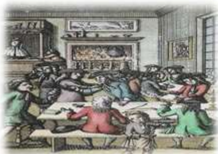
ร้านกาแฟเป็นศูนย์กลางของการพบปะพูดคุยและการวางแผนทางการเมืองสำหรับชนชั้นนำในอังกฤษในคริสต์ศตวรรษที่ 18

ประการที่สี่ พฤติกรรมอย่างเช่น การจับกาแฟ สะท้อนให้เห็นถึงกระบวนการทั้งหมดของพัฒนาการทางสังคมและเศรษฐกิจในอดีต (a whole process of past social and economic development) เช่นเดียวกับอาหารชนิดอื่นๆของชาวตะวันตกซึ่งเป็นที่รู้จักกันดีในปัจจุบัน - อย่างเช่น ชา กล้วย มันฝรั่ง และน้ำตาลทราย- กาแฟได้ถูกนำมาบริโภคกันอย่างกว้างขวางตั้งแต่เมื่อปลายทศวรรษ 1800 เป็นต้นมา แม้ว่าการดื่มกาแฟจะมีจุดกำเนิดในตะวันออกกลาง แต่การขยายตัวของบริโภคขนานใหญ่กลับเริ่มขึ้นในยุคแห่งการขยายตัวของตะวันตกเมื่อประมาณ 150 ปีที่ผ่านมา จริงๆแล้วกาแฟที่พวกเราดื่มกันอยู่ทุกวันนี้มาจากดินแดน [อเมริกาใต้และแอฟริกา] ซึ่งเคยตกเป็นอาณานิคมของชาวยุโรป ดังนั้นกาแฟจึงไม่ได้เป็นเครื่องดื่ม 'ดั้งเดิม' ของตะวันตกแต่อย่างใด มรดกของอาณานิคมมีผลกระทบอย่างมากมาต่อพัฒนาการของการค้ากาแฟระดับโลก