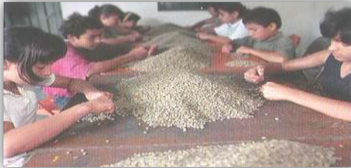
กาแฟมีความหมายสำหรับการดำรงชีวิตของคนงานทั้งหลายที่กำลังคัดเลือก เม็ดกาแฟให้กับสหกรณ์เพื่อการค้าที่เป็นธรรมในอเมริกาใต้

กล่าวคือ กาแฟปริมาณมหาศาลที่ถูกนำไปบริโภคกันในประเทศที่ร่ำรวยนั้นถูกปลูกกันในประเทศที่ยากจน กาแฟเป็นสินค้าที่มีมูลค่ามากที่สุดรองลงมาจากน้ำมันในการค้าระหว่างประเทศ กาแฟกลายเป็นแหล่งรายได้ขนาดใหญ่ที่สุดให้กับหลายประเทศ ในการแลกเปลี่ยนสินค้า การผลิต การแลกเปลี่ยนและการกระจายผลผลิตและสินค้าที่มีชื่อว่ากาแฟนี้ จำเป็นต้องมีการทำธุรกรรมร่วมกันอย่างต่อเนื่องระหว่างผู้คนจำนวนมากที่อยู่ห่างไกลจากผู้ดื่มกาแฟหลายพันไมล์ การศึกษาการทำธุรกรรมระดับโลก (global transactions) ถือว่าเป็นพันธกิจที่สำคัญของสังคมวิทยา เนื่องจากหลายๆแง่มุมของชีวิตของพวกเราขณะนี้ได้รับผลกระทบจากอิทธิพลทางสังคมและการสื่อสารกว้างขวางทั่วโลก