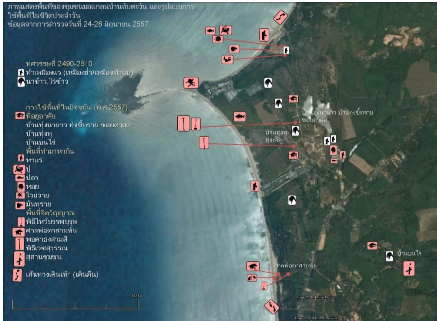
รูปแบบการใช้พื้นที่ตามวิถีชีวิตวัฒนธรรมของชาวมอแกนบ้านทับตะวัน

การทำแผนที่เดินดินช่วยให้เราได้มองเห็นรายละเอียดของแต่ละพื้นที่ และได้เรียนรู้ว่าพื้นที่ชุมชนมีความเชื่อมโยงกันอย่างไร มีปัจจัยอะไรบ้างที่ทำให้พื้นที่ชุมชนเกิดความเปลี่ยนแปลง ได้วิเคราะห์พื้นที่ชุมชนว่า อะไรคือพื้นที่ทางวัฒนธรรมที่ถูกรักษาสืบทอดจากรุ่นสู่รุ่น แบบไหนที่ถูกปรับประยุกต์เพื่อให้สอดคล้องกับเงื่อนไขปัจจุบัน ซึ่งนำไปสู่การประเมินคุณค่าและปัญหาที่เกิดขึ้นกับพื้นที่ร่วมกัน นอกจากนี้คนทำแผนที่ยังได้เรียนรู้ว่าสิ่งสำคัญของกระบวนการทำแผนที่คือการทำงานด้วยกัน ซึ่งจะนำไปสู่การเป็นเจ้าของความรู้ร่วมและการทำงานร่วมกันในอนาคต การทำแผนที่เดินดินจึงอาจเป็นสะพานเชื่อมระหว่างคนและข้อมูลจากชุมชนกับการแก้ปัญหาเชิงนโยบายได้